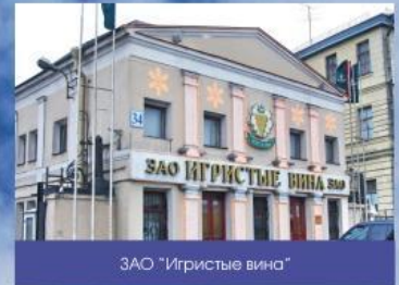
ЗАО "Игристые вина"