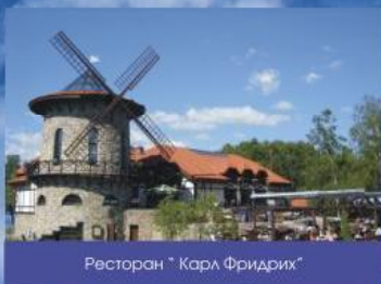
Ресторан "Карл Фридрих"