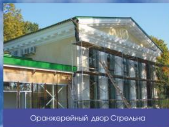
Оранжерейный двор Стрельна