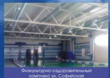
Физкультурно-оздоровительный комплекс ул. Софийская