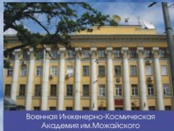
Военная Инженерно-Космическая Академия им.Можайского