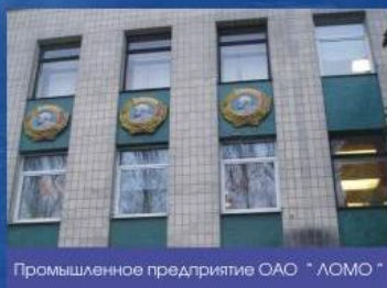
Промышленное предприятие ОАО "ЛОМО"