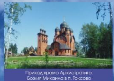
Приход храма Архистратига Божия Михаила в п. Токсово