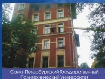
Санкт-Петербургский Государственный Политехнический Университет