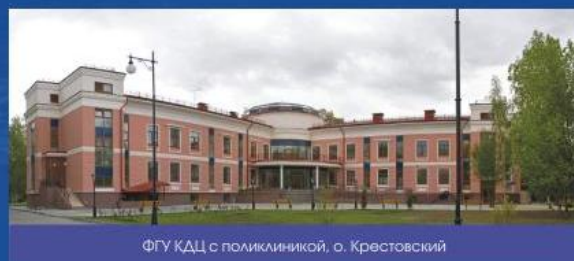
ФГУ КДЦ с поликлиникой, о. Крестовский

Россия Санкт-Петербург Выборгская набережная, д.55 www.amkspb.ru тел:(812) 622-1242 ( многоканальный )