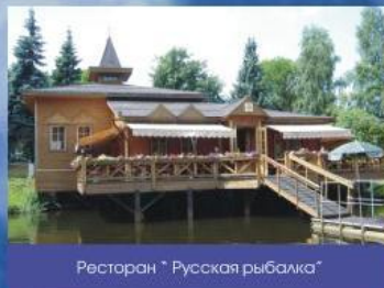
Ресторан "Русская рыбка"